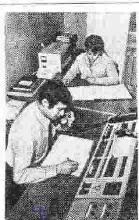
НИКОЛАЕВСКАЯ ОБЛАСТЬ. При Еленецком районном управлении сельского хозяйства создан пункт оперативного управления. С помощью радио, телегазеты и телефонной связи осуществляется руководство 12-ю колхозами и двумя совхозами.

В период полевых работ оперативно оказывается необходимая техническая помощь. Лесушки и планерки с руководителями хозяйств проводятся по радио.