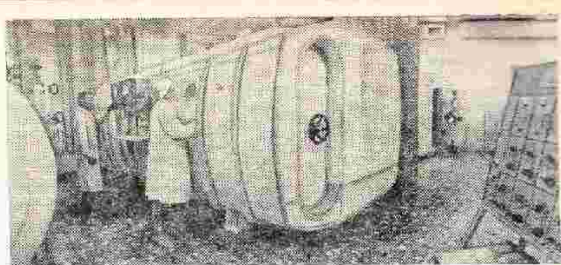
Этот снимок сделан в новом лечебном корпусе 1-го Ленинградского медицинского института имени академика И. П. Павлова — баролaborатории с поликлиническим отделением.

Здесь разместились четыре отделения — баротерапии, лечения сосудистых заболеваний головного мозга, лабораторное и физиологическое. На первом этаже смонтирована уникальная лечебная декомпрессионная камера-отсек, оборудованная современной радиотелеметрической и электронной аппаратурой. Ее пропускная способность — 15 больных одновременно.