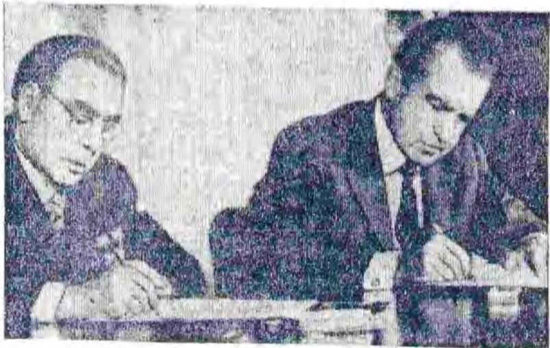
НА СНИМКЕ: во время подписания Соглашения.

Подписание советско-американских документов широко передавалось по телевидению и радио.