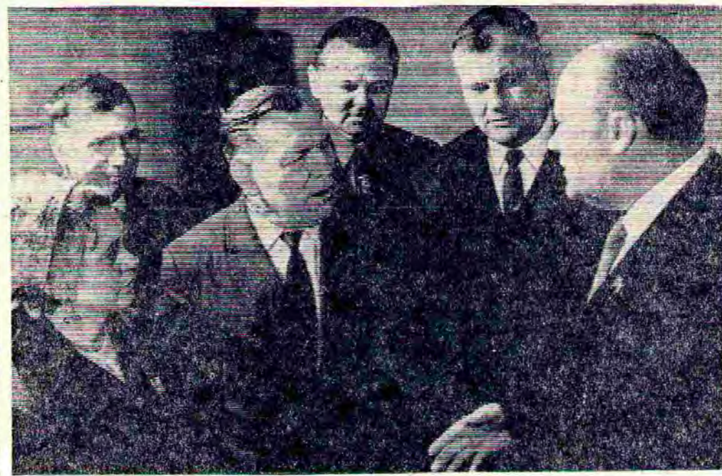
КРАСНОДАРСКИЙ КРАЙ. Колхоз «Кавказ» Курганинского района и ставропольский колхоз «Россия» Новоалександровского района — давние друзья.

Не буду доказывать прописные истины. У себя дома каждый имеет телевизор, радиоприемник, выписывает газеты и журналы. Без этого сейчас не обойтись. Иное дело полевой стан... И мы стремимся к тому, чтобы в те короткие минуты отды-