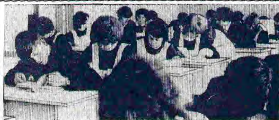
В выпускных классах школ района начались экзамены.