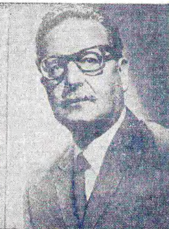
Сальвадор Альенде Госсенс