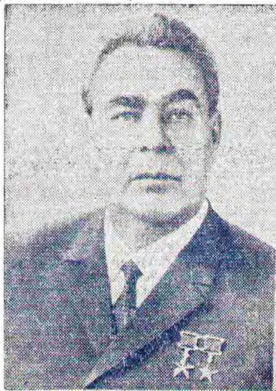
Леонид Ильич Брежнев.

Томский Н. В. (СССР) Георгий Трайков (Болгария) Каору Ясуи (Япония)