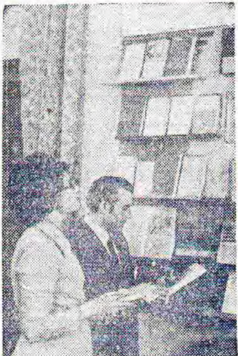
Книжная выставка «Героический путь Ленинской партии», посвященная 70-летию II съезда РСДРП, открылась в Хабаровской краевой библиотеке. На ней представлены работа В. И. Ленина «Рассказ о II съезде РСДРП», другие его произведения, текст постановления Центрального Комитета КПСС «О 70-летию II съезда РСДРП».