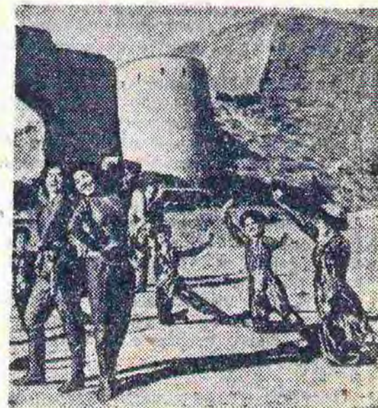
ТАДЖИКСКАЯ ССР. Ансамбль «Лола» — лауреат премии Ленинского комсомола Таджикистана.