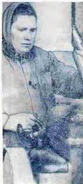
На 110—115 процентов выполняет ежедневное задание вальцевая 5 разряда крупноцеха Богословского кукурузообрабатывающего комбината Е. К. Старушенко (на снимке).

Огромная работа была проведена в период подготовки к 50-летию образова-