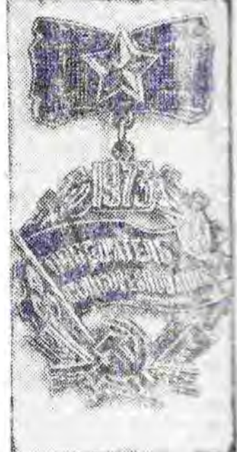
Единый общесоюзный знак «Победа» победителей социалистического соревнования 1973 года. Фотохроника ТАСС

Мосиенко, А. С. Дьяченко и других учатся остальные. Механизаторы повышают свою квалификацию на специальных курсах, что способствует наиболее полному и рациональному использованию техники, сельскохозяйственных машин. Социалистическое соревнование, развернувшееся среди коллективов отделений, ферм, между рабочими, проводимые взаимопроверки — дают возможность направить усилия всех тружеников на выполнение заданий девятой пятилетки. Поэтому партийный комитет позаботился о том, чтобы на решающих участках хозяйственной деятельности были коммунисты, и своим примером вели за со-