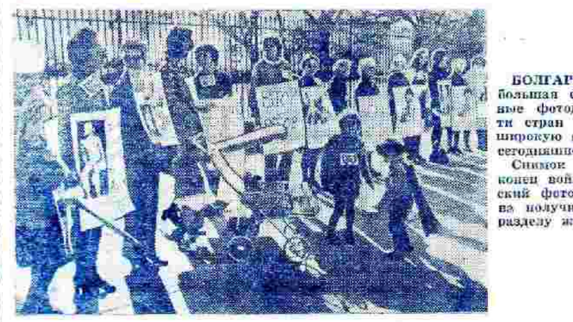
БОЛГАРИЯ. В Софии проведена большая фотовыставка. Прогрессивные фотодокументалисты пятидесяти стран пяти континентов создали широкую и впечатляющую панораму сегодняшнего мира. Снимок «Американцы требуют — конец войне». За эту работу советский фотокорреспондент Л. Пасомова получила бронзовую медаль по разделу жанровой съемки.