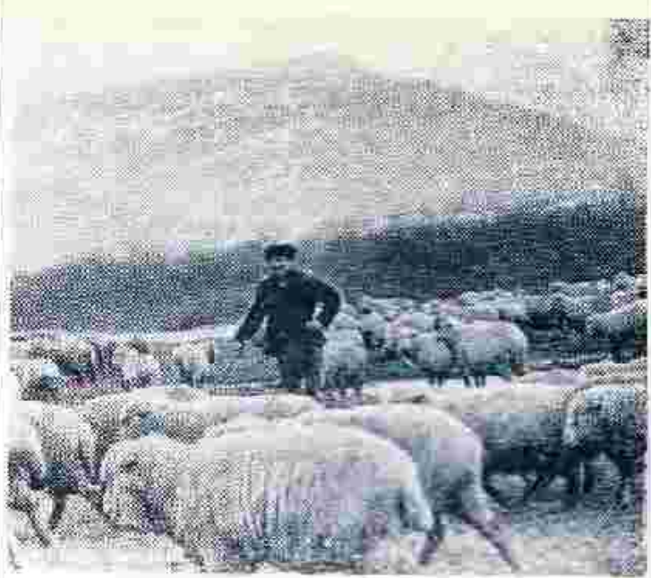
КАРАЧАЕВО-ЧЕРКЕССКАЯ АВТОНОМНАЯ ОБЛАСТЬ. Колхоз «Знамя коммунизма» Зеленичского района досрочно выполнит квартальный план продажи мяса государству. В минувшем году от реализации продукции животноводства сверх плана хозяйства получили почти 100 тысяч рублей прибыли. Уверенные старт взяли животноводы в решающем году девятой пятилетки.

Уборку кукурузы начинаем при влажности 35—40 процентов комбай-