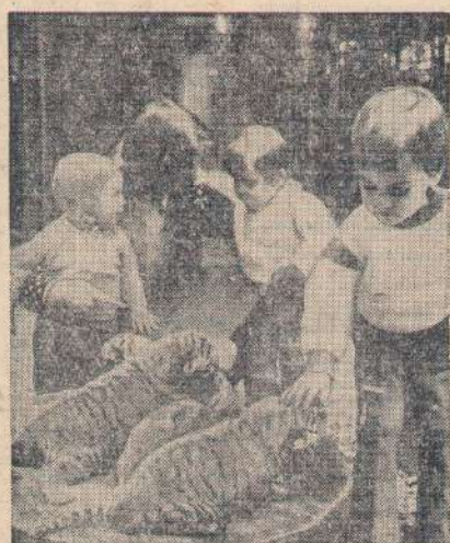
В Будапештском зоопарке. Эти смиренные полосатые коты, которых пока еще безбоязненно может погладить ребенок, скоро превратятся в могучих красавцев-тигров.