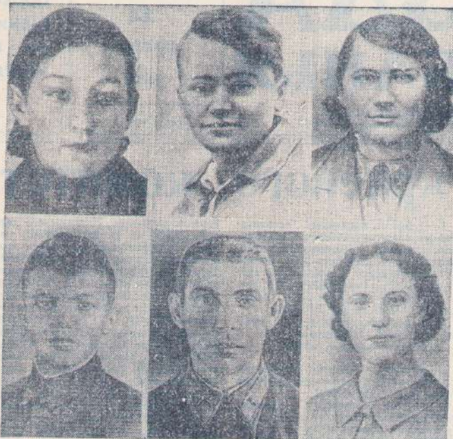
«Зоя Космодемьянская, Олег Кошевой, Лиза Чайкина, Александр Матросов, Николай Гастелло, Марите Мельникайте... достаточно произнести эти имена, и перед нами возникает яркая волнующая картина массового героизма, самоотверженности, душевной чистоты и благородства, каких не знала история прежних эпох».