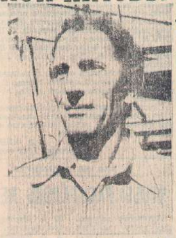
...ниа он выдал 4400 тонн силосной массы.

Первостепенной задачей кормодобывчиков является вдоволь обеспечить силосом на зиму комплекс по выращиванию племенных нетелей. Вблизи его строители заблаговременно соорудили из бетонных плит вместительные траншеи. Все здание ком-