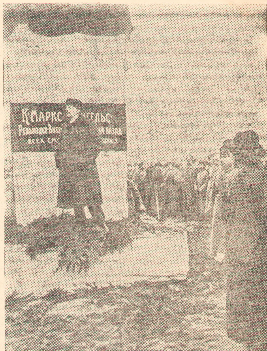
На снимке: В. И. Ленин произносит речь на открытии временного памятника К. Марксу и Ф. Энгельсу. Москва 7 ноября 1918 года.