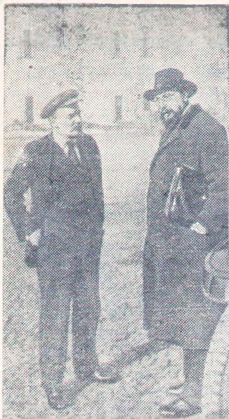
В. И. Ленин и В. Д. Бонч-Бруевич во дворе Кремля. Октябрь 1918 года.