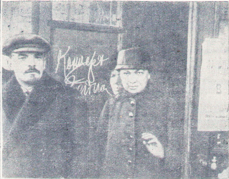
го съезда по внешкольному образованию. Москва, 6 мая 1919 года.