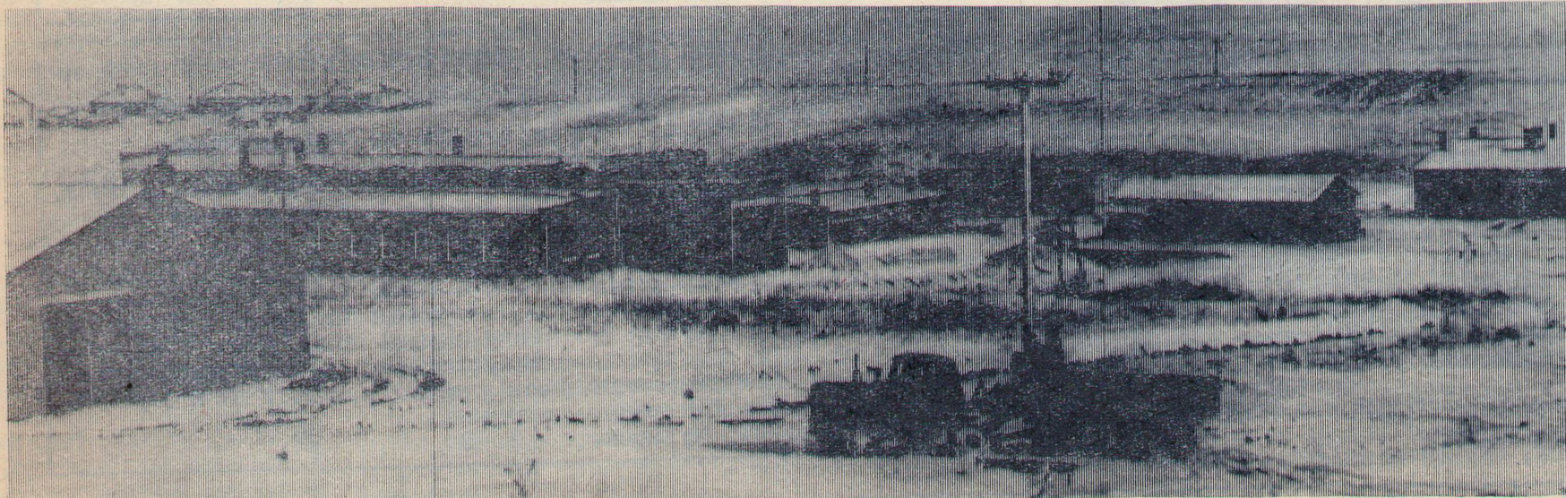
НА СНИМКАХ: эскиз центра хутора, строящаяся школа и мастерские колхоза.

Д. МЯЛЕНКО, главный экономист колхоза. Б. УРАЛЬЦЕВ, наш корр.