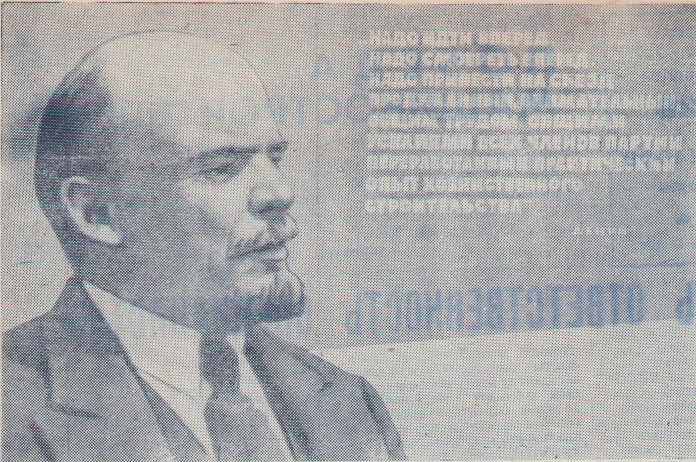
Плакат художника Б. Березовского, выпущенный издательством «Изобразительное искусство» к XXIV съезду КПСС.

А. АНЗИН, главный зоотехник сельхозуправления.