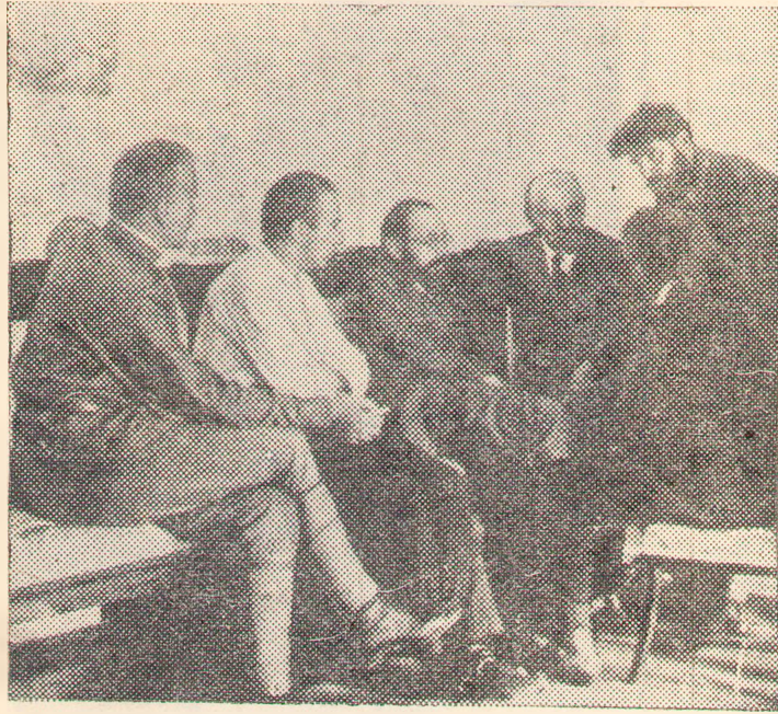
В. И. Ленин в Кремле беседует с итальянскими делегатами II конгресса Коминтерна. Москва, июль-август 1920 года. (Архив Института марксизма-ленинизма при ЦК КПСС).