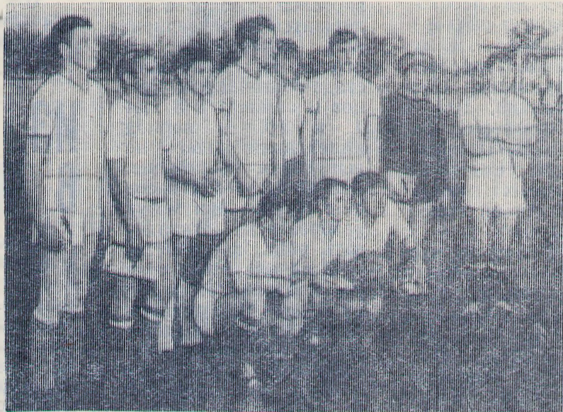
На днях на стадионе колхоза имени Ленина состоялся очередной матч мотоболлистов. Хозяева поля со счетом 0:3 проиграли более техничной ипатовской команде «Спутник».

НА СНИМКЕ: обладатель кубка команда колхоза «Казьминский».