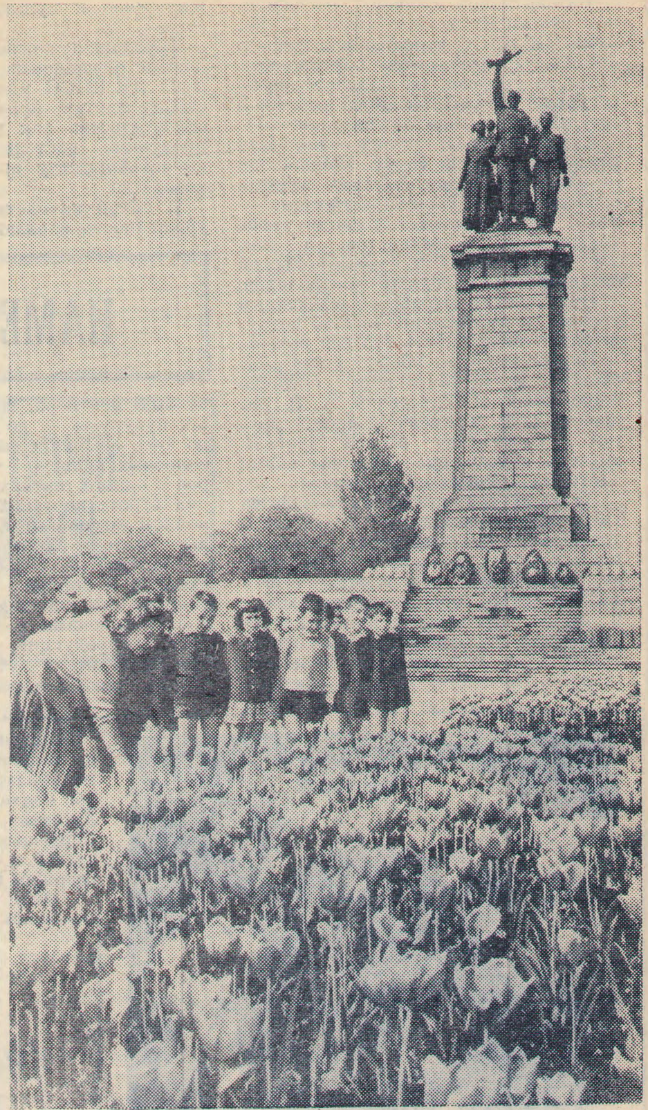
Монумент в честь Советской Армии — освободительницы, установленный в Софии — столице Народной Республики Болгарии.