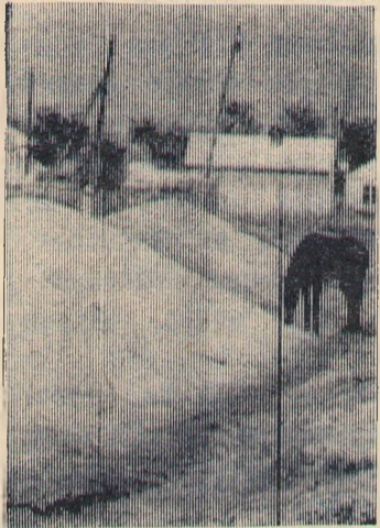
Лошадка довольна: на току никого — ешь, сколько хочешь зерна (совхоз «Кочубеевский»).

Все это вроде бы и мелочи, но без них не