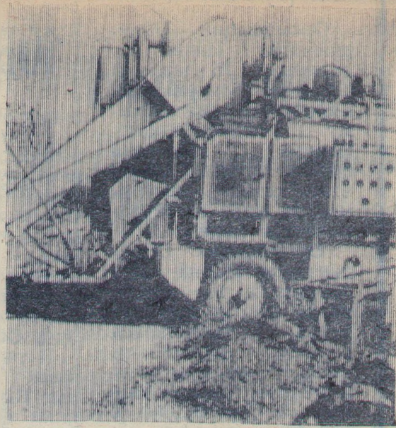
У зерносклада колхоза имени Чапаева стоит новая машина для протравливания семян, но она уже разукрупнена.

Хорошие зернохранилища в колхозах имени Чапаева и «Казьминский». Но беда в том, что заведующие токами не организовали тщательную сортировку семян по репродукциям, не отгородили их от фуражного зерна. Кое-где еще не очищен ячмень и по свидетельству контрольно-семенной лаборатории в этом году первоклассных семян подготовлено меньше чем в прошлом. Не везде организовано протравливание.