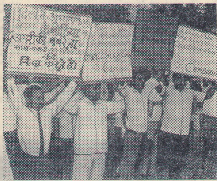
Общественность Индии решительно осуждает агрессию американо-сайгонской военщины в Камбодже. Во многих городах страны проходят мощные демонстрации протеста против вмешательства США во внутренние дела камбоджийцев. НА СНИМКЕ: преподаватели вузов и школ. Дели протестуют против американской агрессии.

укрепления мира, и в первую очередь вопрос о рассмотрении мер по укреплению международной безопасности. XXV сессия рассматривает также вопросы о всеобщем и полном разоружении, о запрещении применения химического и бактериологического оружия. Ассамблея обсудит вопрос «Осуществление Декларации о предоставлении независимости колониальным странам и народам». Несомненно, в центре внимания ораторов на юбилейной сессии будут вьетнамская проблема и ближневосточный кризис.