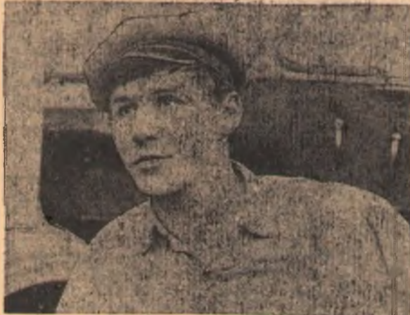
Кукурузу — в закрома