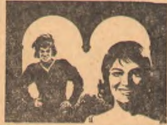
Много шума из ничего

17 — 18 ноября. Новый цветной широкоэкранный художественный фильм.