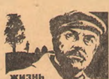
Жизнь на грешной земле

19 — 20 ноября. Новый широкоэкранный художественный фильм.