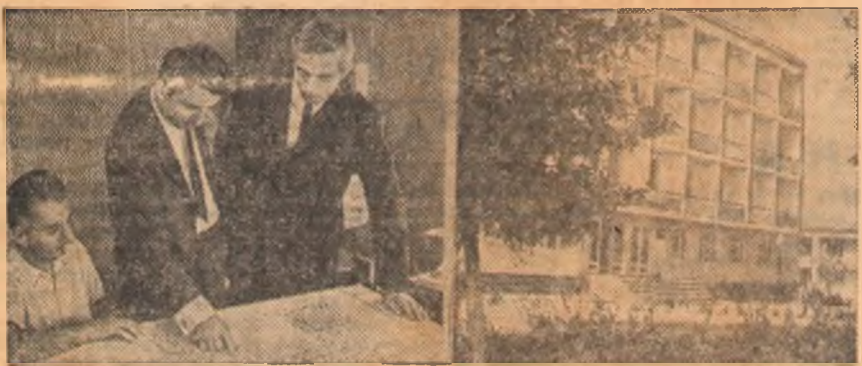
ДАГЕСТАНСКАЯ АССР. Трех-четырёхэтажные дома со всеми удобствами, асфальтированные улицы, стадион, музыкальная и художественная школы, Дом быта в поселке совхоза имени Алиева Дербентского района.