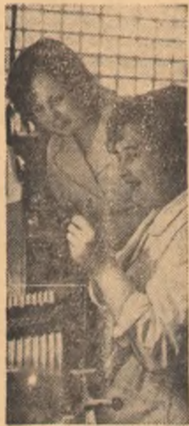
МОСКВА. Наравне с мужчинами женщины активно трудятся на заводах и фабриках, стройках, предприятиях быта, активно участвуют в обществен-