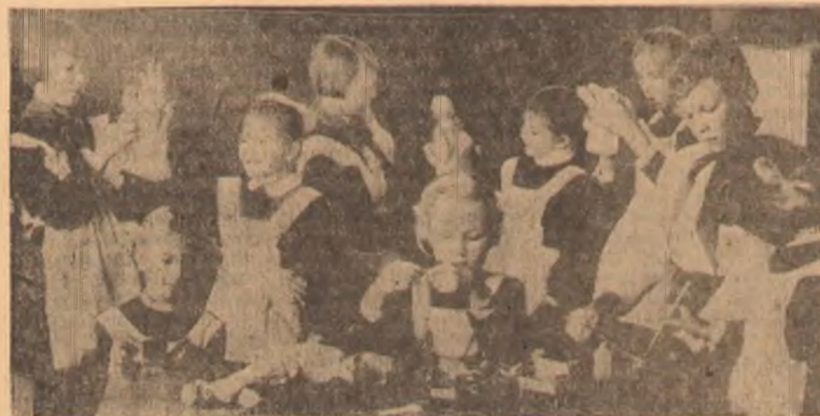
НА СНИМКЕ: октябрятки из «кондитерской» и «мебельной» фабрик готовят «конфеты» на елку и «мебель» на выставку.

Ставропольское межрайонное отделение «Энергосбыт» НАПОМИНАЕТ