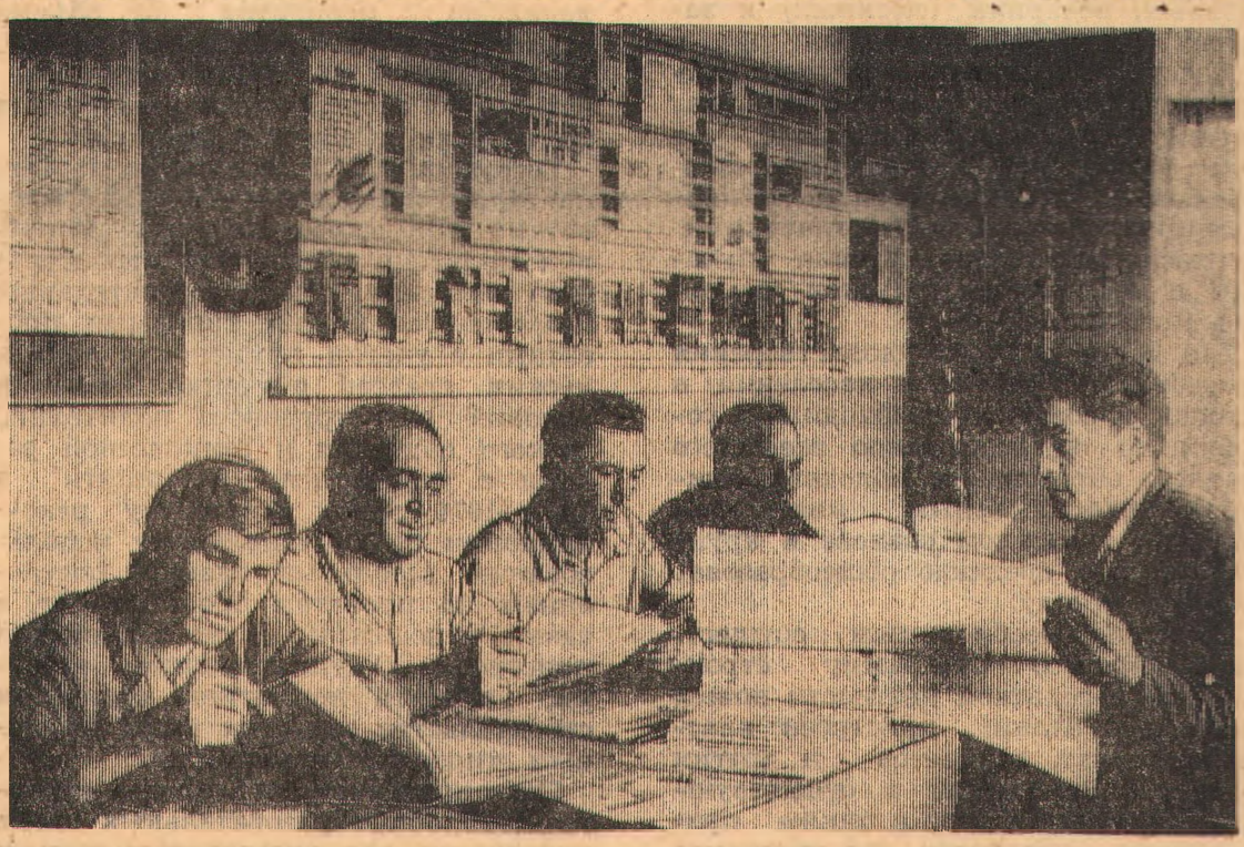
На снимке: механизаторы третьей тракторной бригады в красном уголке.