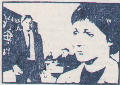
КАЖДЫЙ ВЕЧЕР ПОСЛЕ РАБОТЫ

9-10 февраля. Новый художественный фильм