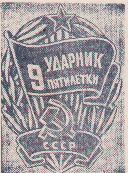
Знак «Ударник девятой пятилетки».