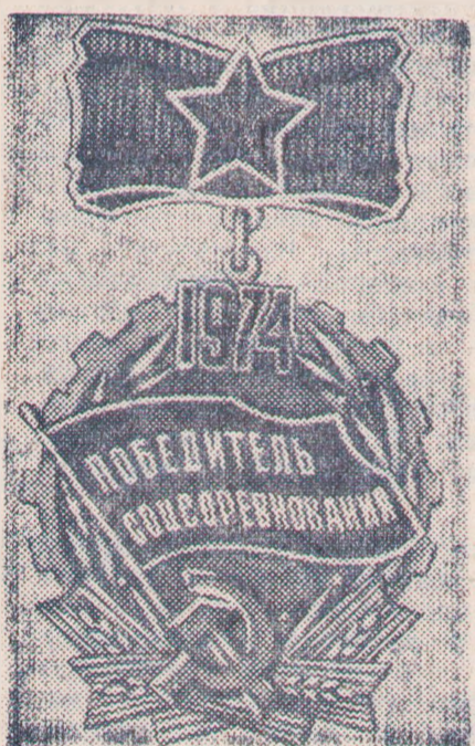
Знак «Победитель социалистического соревнования 1974 года».