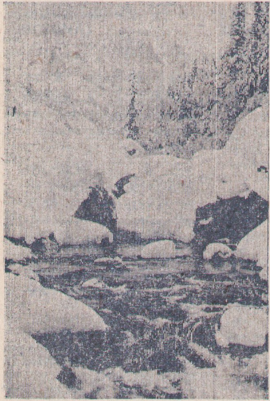
НА СНИМКЕ: вид на Домбай-Ульген.