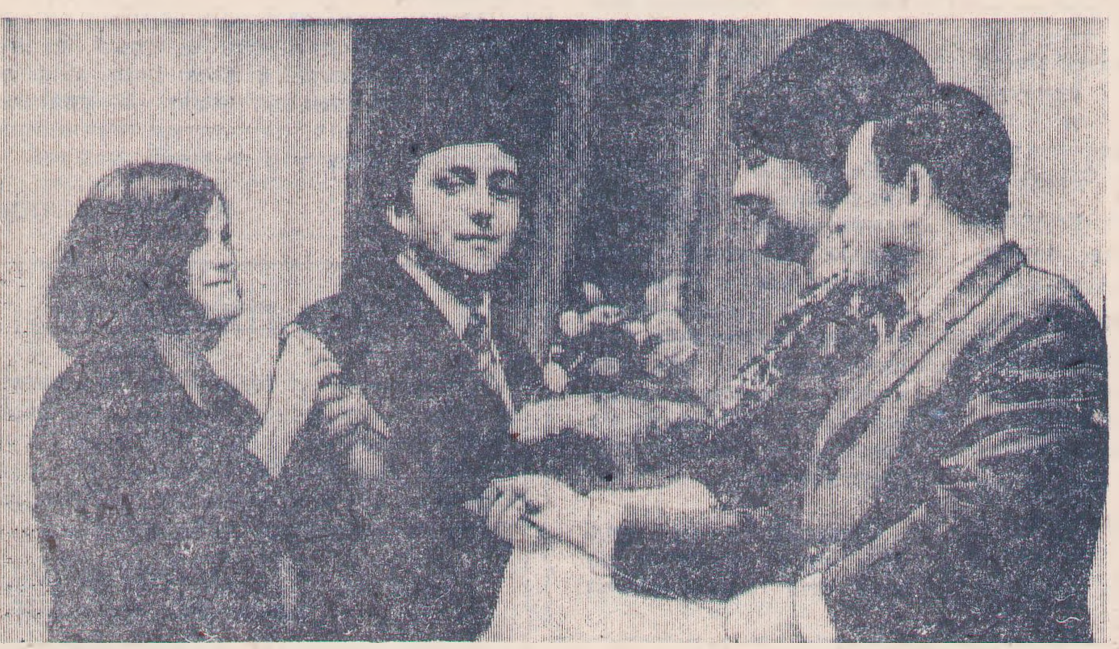
Недавно в районном Дворце культуры состоялся концерт заслуженной артистки РСФСР Ольги Воронец. Зрители тепло встретили замечательную советскую певицу и в знак признательности преподнесли ей хлеб, соль и живые цветы.