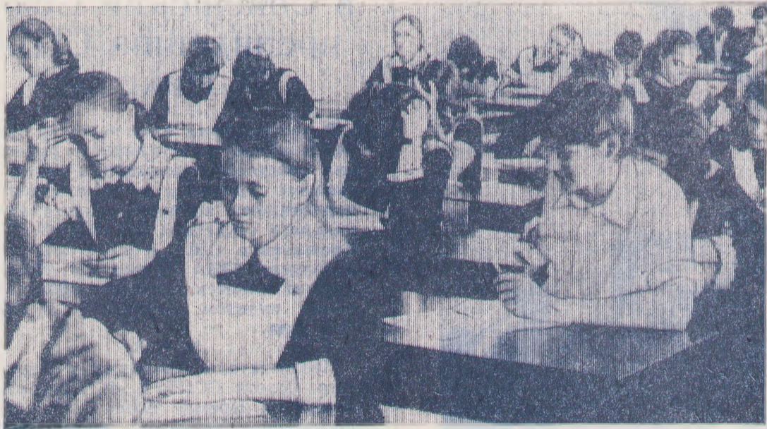
В школах района начались экзамены. Учащиеся 10 классов Кочубеевской средней школы сдают экзамены по русскому языку. Большинство учащихся темой сочинения избрали «Горький — певец рабочего класса» по роману писателя «Мать». Некоторые взяли тему «Партия — ум, честь и совесть нашей эпохи» (В. И. Ленин).