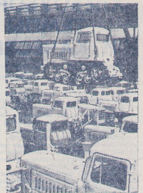
Продукция четырехжды орденоносного Волгоградского тракторного завода хорошо известна в нашей стране и далеко за ее пределами. Каждый день с отгрузочной площадки уходят эшелоны с тракторами «ДТ-75», болотоходными, крутосклонными машинами.

О. ТОМАШЕВСКИЙ, первый секретарь Кочубеевского райкома КПСС; «Ставропольская правда» за 21 июля 1974 г.