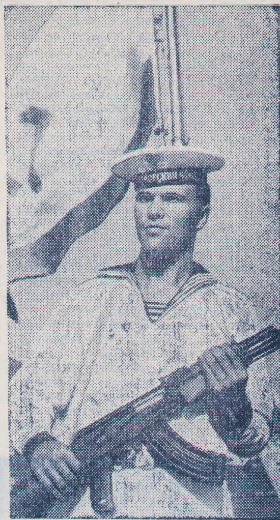
Почетная вахта (Краснознаменный Черноморский флот).

Завтра — День Военно- Морского Флота СССР