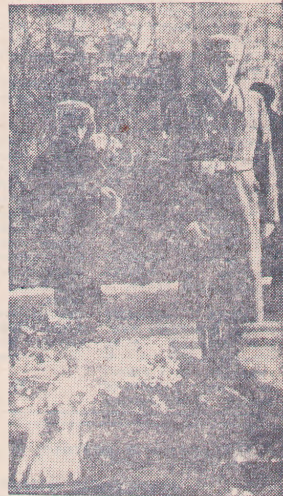
ВОЛГОГРАД. В стужу и зной в сквере на площади Павших борцов у Вечного огня, что зажжен на братской могиле защитников красного Царькина и Сталинграда, стоят в почетном карауле наследники боевой славы.