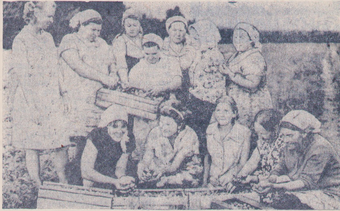
НА СНИМКЕ: сбор земляники в совхозе «Правокубанский».