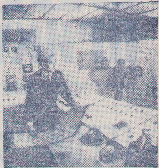
ВОЛГОГРАДСКАЯ ОБЛАСТЬ. Коллектив ордена Ленина Себряковского цементного завода является участником соревнования цементников страны.

На передовом предприятии самая высокая в отрасли производительность труда. За 4 года пятилетки здесь выработано свыше 60 тысяч тонн цемента дополнительно к плану.