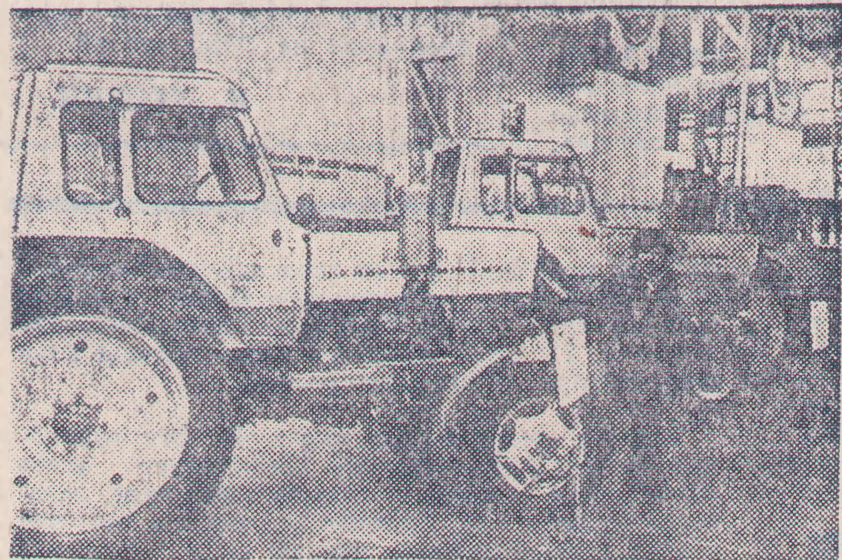
МОСКВА, ВДНХ СССР. Тематическая выставка «Новая сельскохозяйственная техника».

НА СНИМКЕ: новые тракторы Минского тракторного завода. На переднем плане — трактор МТЗ-82, предназначенный для сельскохозяйственных работ на повышенных скоростях от 9 до 15 километров в час в агрегате с комплексом навесных, полунавесных и прицепных машин.