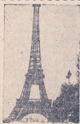
ПARIЖ. Эйфелева башня. (ТАСС).

Хлебокомбинату Кочубеевского райпо на постоянную работу требуются газосварщики и электрик. 4—2