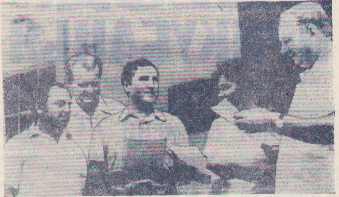
На снимке: совет социального планирования за работой.

Такой же процесс наблюдается и среди животноводов. Растет их мастерство заметно. Так, за пять лет звание мастера — животновода первого и второго класса присвоено 139 колхозникам. Однако снимает ли это проблему обеспеченности кадрами этой важной отрасли? Отнюдь нет. И особенно остро она ощущается в овцеводстве. А если сравнить возрастные группы колхозников, то картина открывается еще более печальная. Судите сами: до 20-летнего возраста в колхозе работает 27 человек, а от 40 до 60 лет — 898, или почти две трети всего состава. Решить эту проблему однозначно нельзя, но улучшить условия труда — задача первостепенной социальной важности.