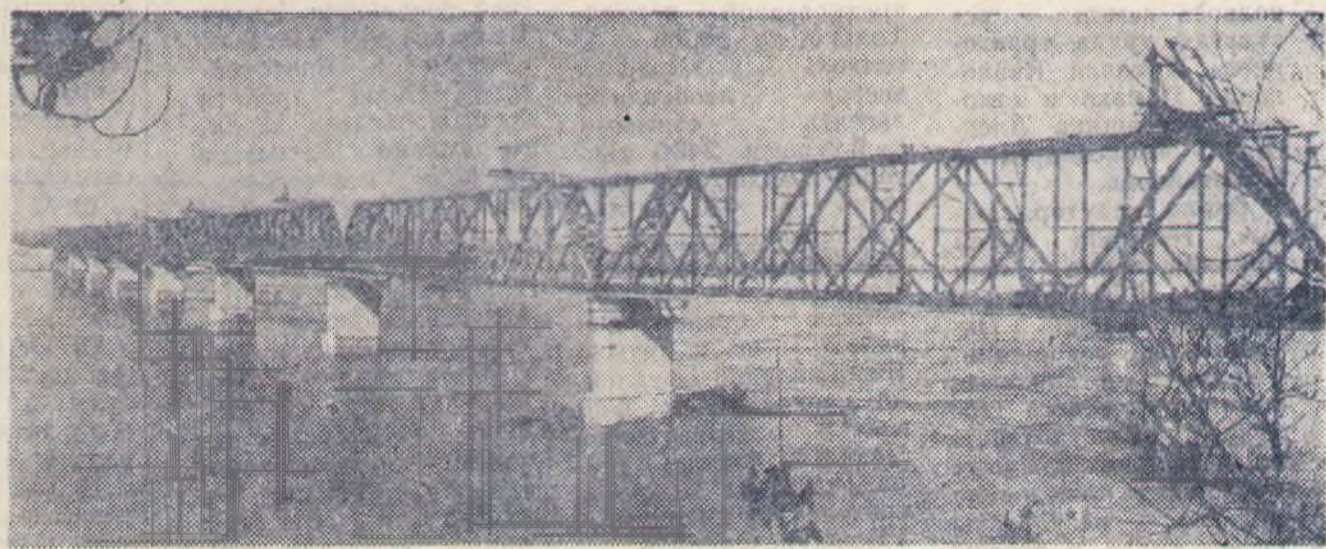
ХАБАРОВСКИЙ КРАЙ. На три месяца раньше срока завершено строительство крупнейшего железнодорожного моста через Амур в районе Комсомольска. Новый мост свяжет строящуюся Байкало-Амурскую магистраль с железной дорогой, идущей к Тихому океану. НА СНИМКЕ: мост через Амур.