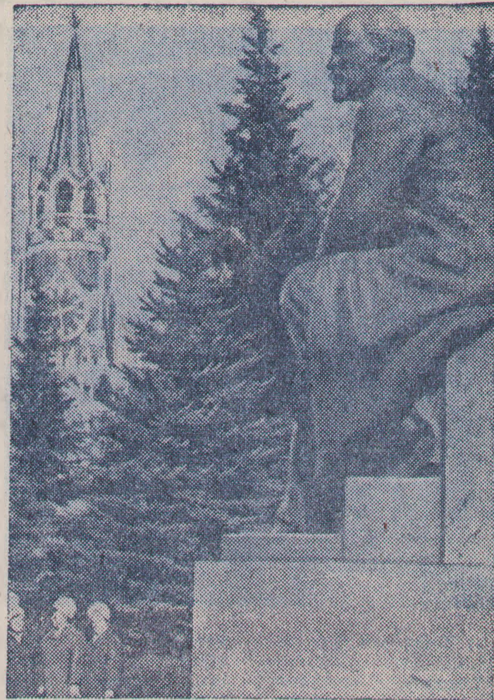
МОСКВА. Памятник В. И. Ленину в Кремле.

МОСКВА. (ТАСС). В Кремлевском Дворце съездов продолжает работу XXV съезд КПСС.