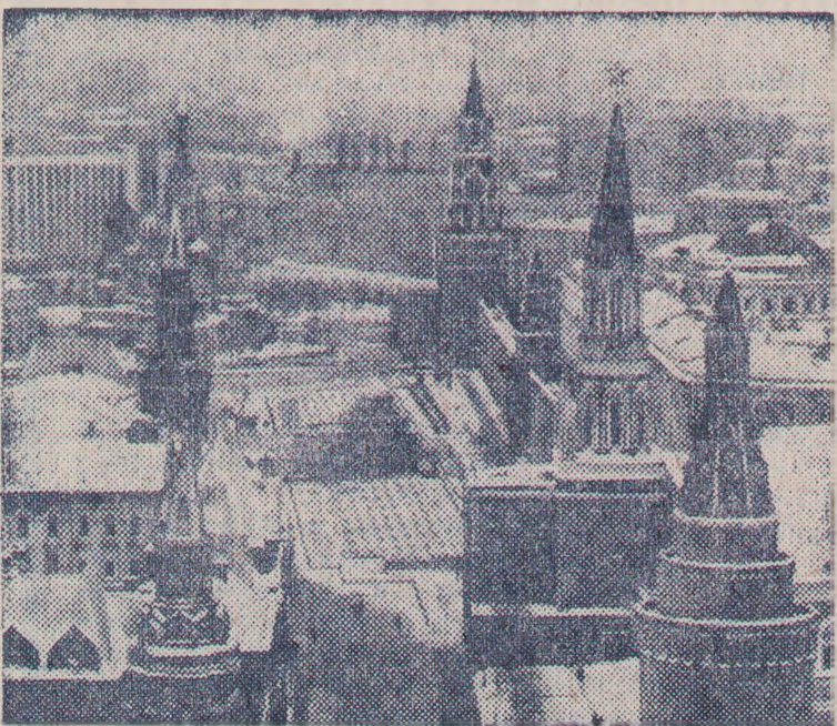
МОСКВА. Вид на Кремль и Красную площадь.

Затем съезд приветствовали горячо встреченные делегатами и гостями товарищи: Николае Чаушеску — Генеральный секретарь Румынской коммунистической партии, Президент СРР, Кейсон Фомвихан — Генеральный секретарь Центрального Комитета Народно-революционной партии Лаоса, премьер-министр Лаосской Народно-Демократической Республики, Юмжагийн Цеденбал — Первый секретарь Центрального Комитета Монгольской народно-революционной партии, Председатель Президиума Великого народного хурала МНР.