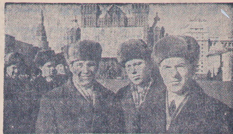
На снимке: группа делегатов съезда.