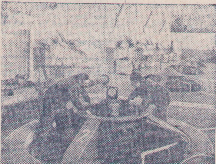
в эксплуатацию новые орошаемые земли общей площадью 4.500 гектаров.

В 1976 году строители продолжают работы по расширению магистрального канала, готовят к сдаче