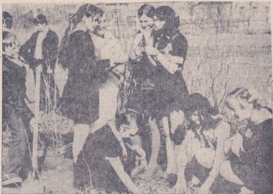
Пришла весна, а вместе с ней появились заботы и у пионеров 6—7 классов Кочубеевской средней школы № 1. Сейчас они работают на пришкольном участке (на снимке).