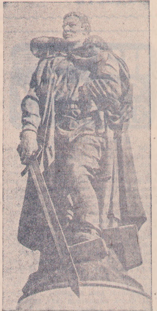
ГДР. БЕРЛИН. Памятник советским воинам в Трептов-парке. Центральная фигура ансамбля.