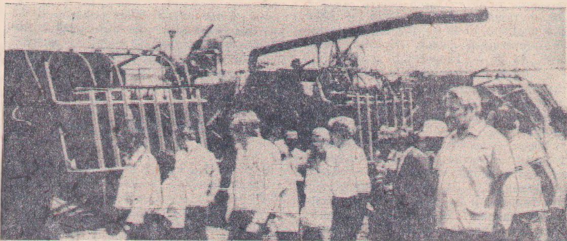
НА СНИМКЕ: участники районного предуборочного совещания на первом производственном участке колхоза имени Балахонина осматривают технику, оборудованную для сбора соломы.

Хлеборобы района делом ответят на заботу партии и правительства о благе советского народа, внесут достойный вклад в успешное выполнение решений XXV съезда КПСС.