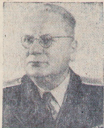
На снимке: М. М. Литвинов.

международную безопасность. Он энергично выступал в Лиге наций в защиту народов, ставших жертвами фашистской агрессии. В годы Великой Отечественной войны Литвинов много сделал для укрепления антигитлеровской коалиции.