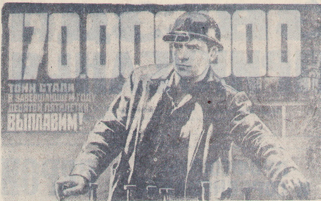
Плакат художника В. Корешко. Издательство «Плакат».